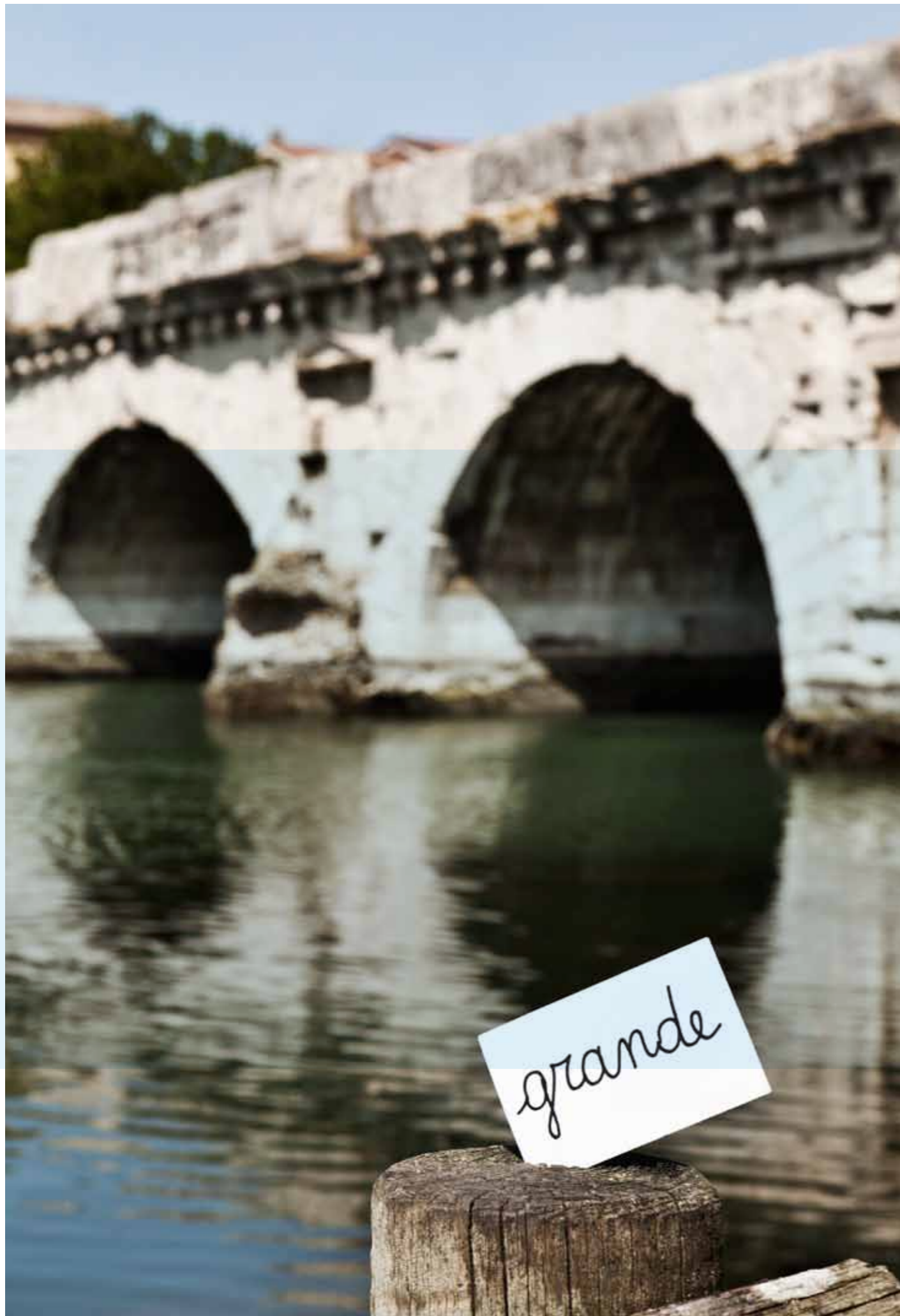
Ponte di Tiberio, Rimini